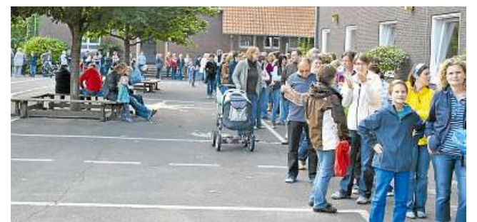
Lange Schlangen bildeten sich auf dem Schulhof der Achtermann-Schule.