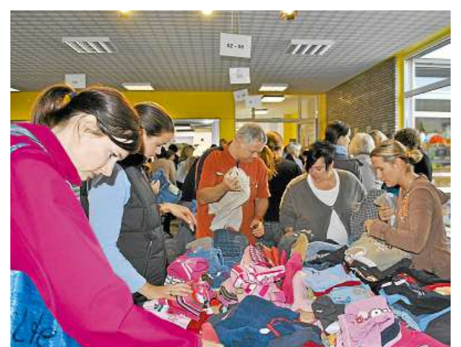
Groß war die Auswahl an Herbst- und Winterkleidung beim Mutter-Kind-Basar.