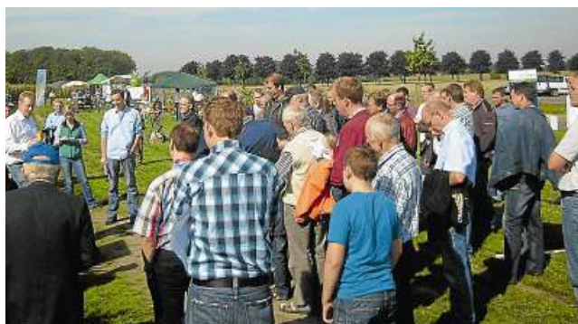
34 Maissorten, aber auch Pflanzen für Gründüngung und Energiegewinnung, interessierten die Besucher des Maisfeldtages.

Für alle, die am Sonntag keine Zeit hatten, findet heute in Sassenberg (Greffener Straße, Sägewerk Tarner) eine weitere Informationsveranstaltung statt, dieses Mal mit Pflanzen, die besser für leichte Böden geeignet sind.